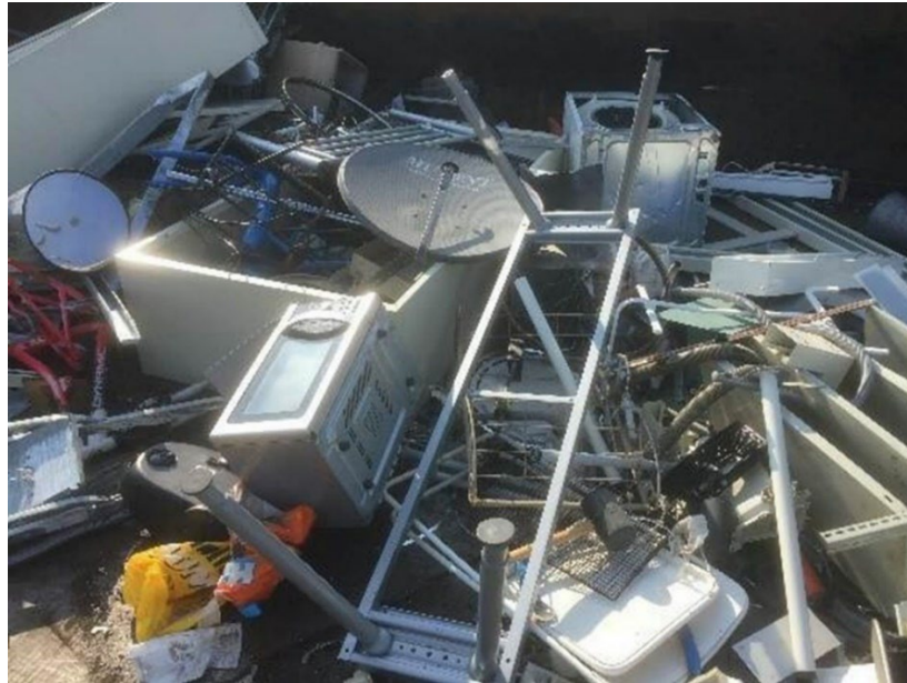
Foto: afgedankte elektrische en elektronische apparatuur in een container met schroot