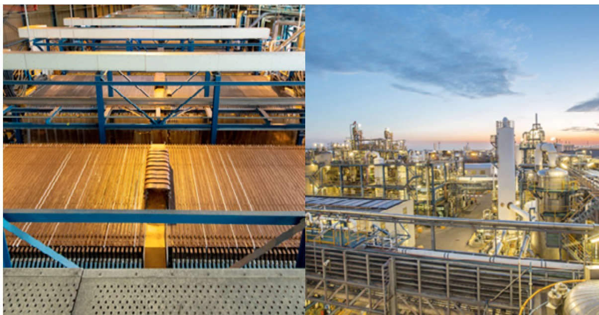
Afbeelding 3: Elektrolyserhal (links) in de Rotterdamse chloor-alkali-fabriek van Nobian (rechts). Elektrolyse is een van de sleuteltechnologieën waarmee een nieuw raffinageproces voor battery-grade lithium wordt ingericht.

Lithium zit in vrij lage concentraties in de Nederlandse bodem in bijvoorbeeld geothermische bronnen of productiewater van olie- en gaswinning. TNO neemt op zich om de beste vindplaatsen in kaart te brengen. Vanuit zoutwinning bekende en nog te ontwikkelen technieken zijn nodig om dit lithiumzout te winnen. Het gewonnen (of op termijn gerecyclede) lithiumzout moet vervolgens worden omgezet naar een vorm die bruikbaar is in batterijen. Chemiebedrijf Nobian heeft een uniek proces ontworpen om op een economische wijze lithiumchloride uit een geothermische brijn (ondergrondse zoutoplossing) of een andere bron (zoals recycling) om te zetten naar hoogzuiver lithiumhydroxide voor batterijen. Eerste experimenten op laboratoriumschaal zijn uitgevoerd en het proces dient verder te worden ontwikkeld en opgeschaald, eerst in een pilotinstallatie en vervolgens in een grotere proeffabriek. De kosten voor de pilotinstallatie bedragen ca € 2 miljoen en voor de proeffabriek € 22 miljoen. DICE-score: 17 voor winning uit geothermische bron; 16 voor lithiumraffinage