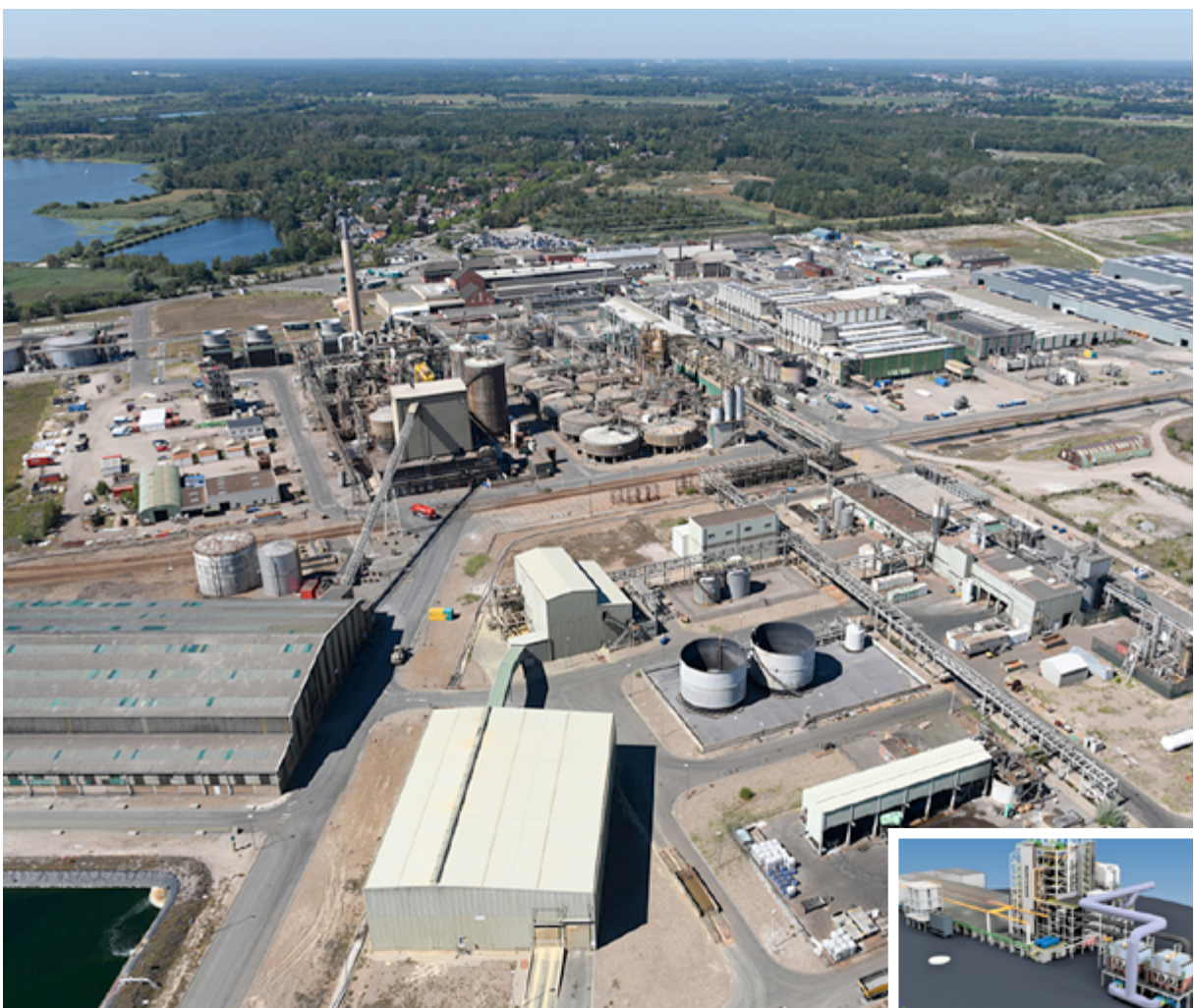
Afbeelding 4: De Metal Recovery Facility is voorzien op het terrein van Nyrstar in Budel.

De doelstelling van het Nyrstar-project is om een germanium- (en mogelijk gallium- en indium)- concentraat te produceren, dat door bestaande en nieuwe raffinage-partners verder verwerkt kan worden. Het concrete doel is om een operationele demoplant te bouwen die een hoeveelheid (ongeveer 25% van beoogde commerciële installatie) kan produceren. De kosten voor deze demonstrator bedragen ca € 24 miljoen (ontwikkeling, capex en opex). DICE-score: 13,75.