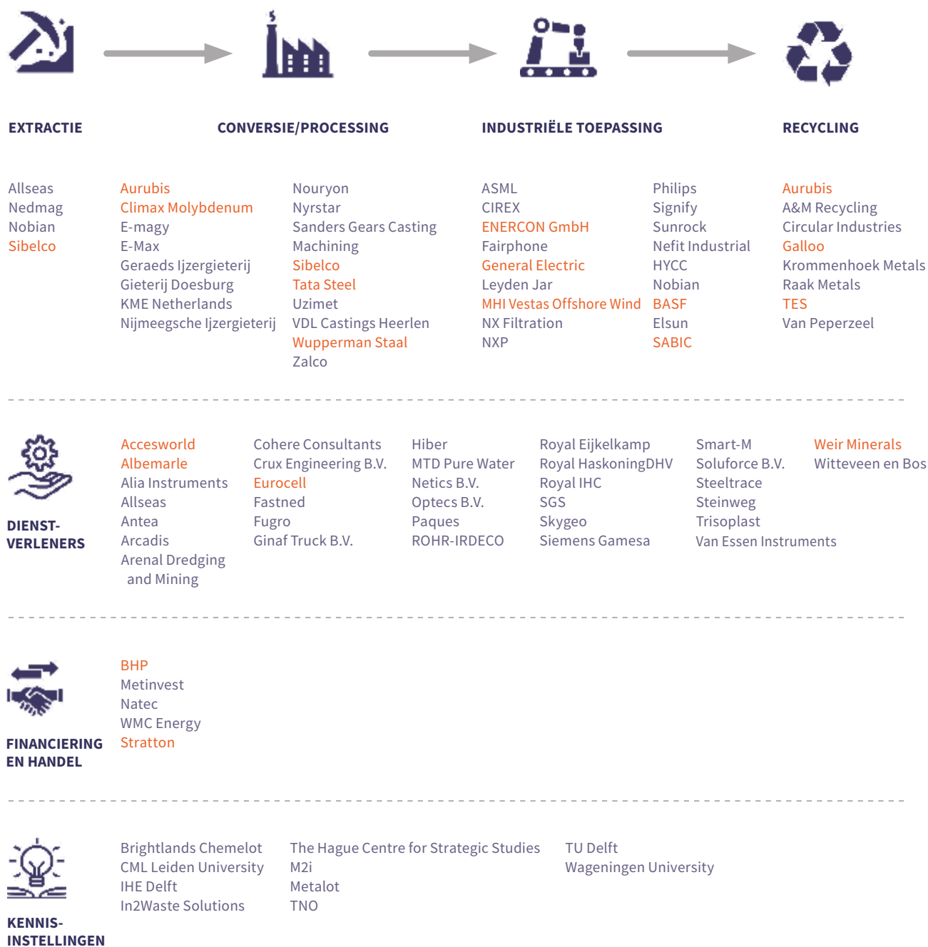
Afbeelding 2. Activiteiten van Nederlandse bedrijven in leveringsketens van metalen en mineralen. Opmerking: Deze lijst is niet uitputtend. De bedrijven zijn ingedeeld volgens hun activiteiten in Nederland, maar kunnen elders in andere sectoren actief zijn.